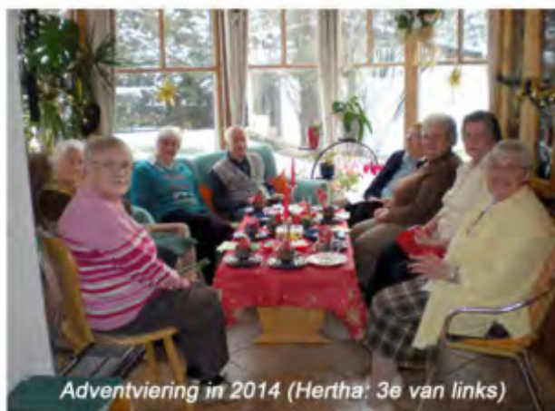
Adventviering in 2014 (Hertha: 3e van links)

Uw woord is een lamp voor mijn voet en een licht op mijn pad.