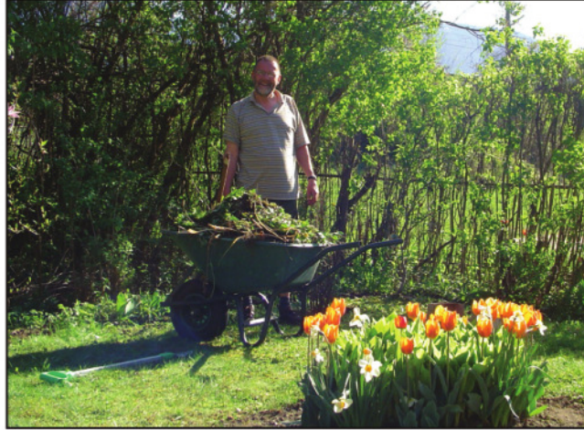
Kruiwagens vol onkruid werden afgevoerd

Toen het klaar was hadden de mannen een rood lint gespannen en samen bedacht, dat Gré het lint mocht doorknip-