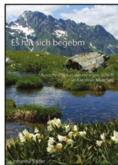
In 2011 kwam de herdruk van dit dichtbundeltje uit