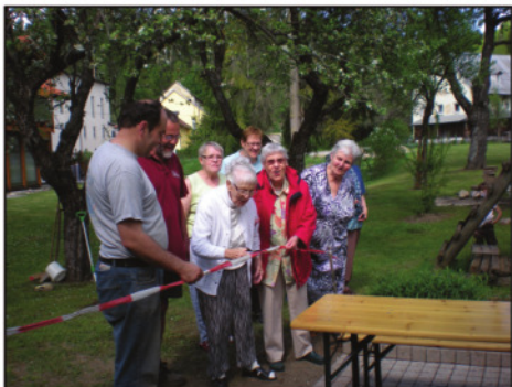
Hierbij verklaren wij...