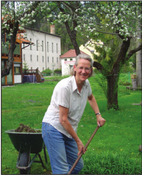
Wat een werk werd er verzet!

Dàt geeft precies het gevoel weer waarmee wij naar huis reden, nadat we van 27 april tot 5 mei in Oostenrijk geweest waren. Onze handen hebben in die week wat klussen gedaan, maar doordat de harten van onze zussen er zó bij betrokken waren, was het 'licht werk'.